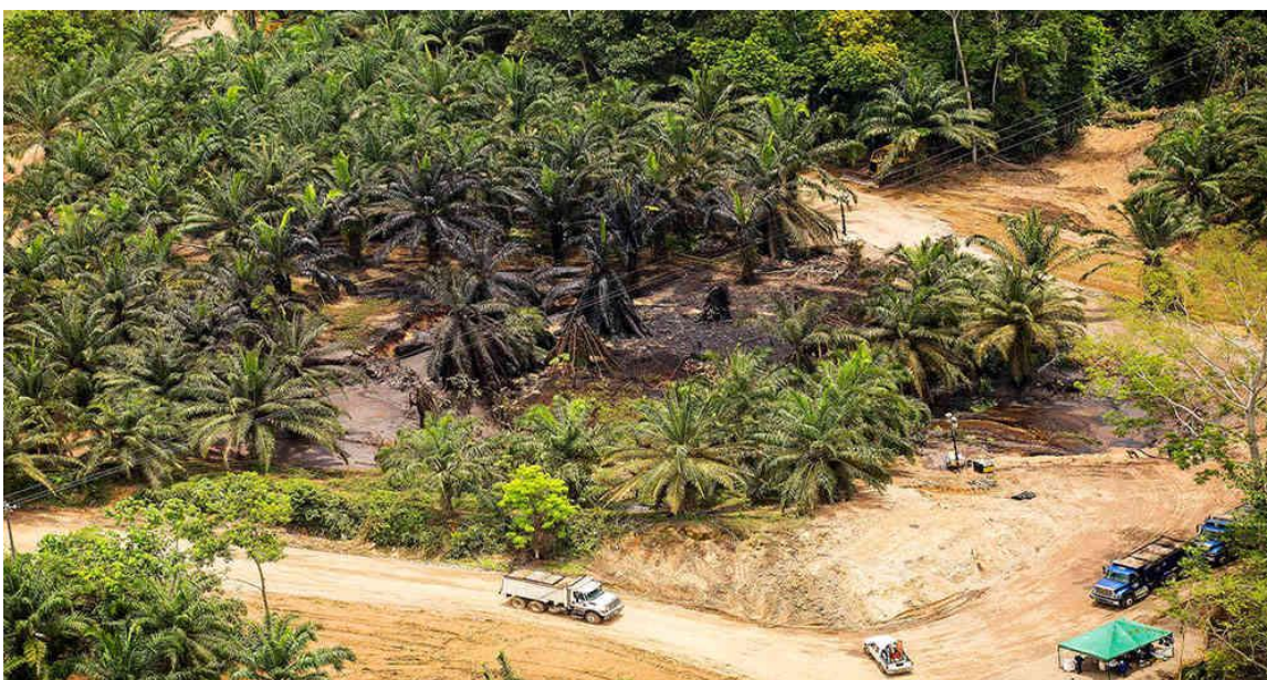
Investigan a presidente de Ecopetrol por emergencia en el pozo Lizama