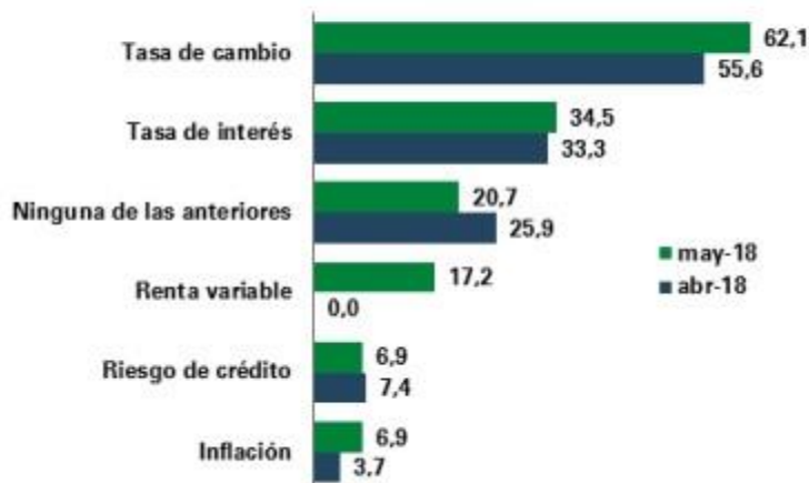
Gráfico 14. Cobertura de los Diferentes Tipos de Riesgo para los Próximos 3 meses (% de respuestas)