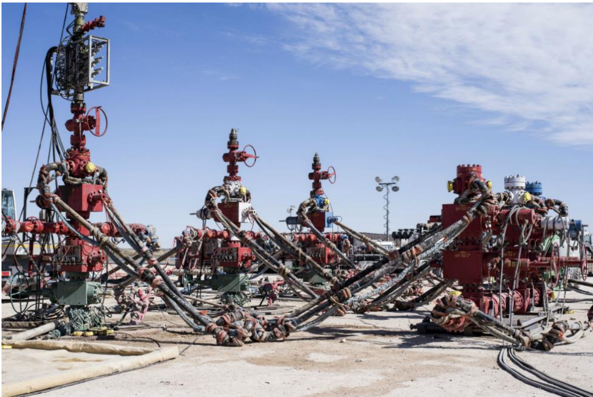
La maquinaria utilizada para fracturar las formaciones de esquisto.

El presidente de la estatal Agencia Nacional de Hidrocarburos, Orlando Velandia, indicó que "si se ha de hacer (el fracking) se hace con compañías que tengan experiencia, que tengan el capital y estamos ajustando el marco normativo".